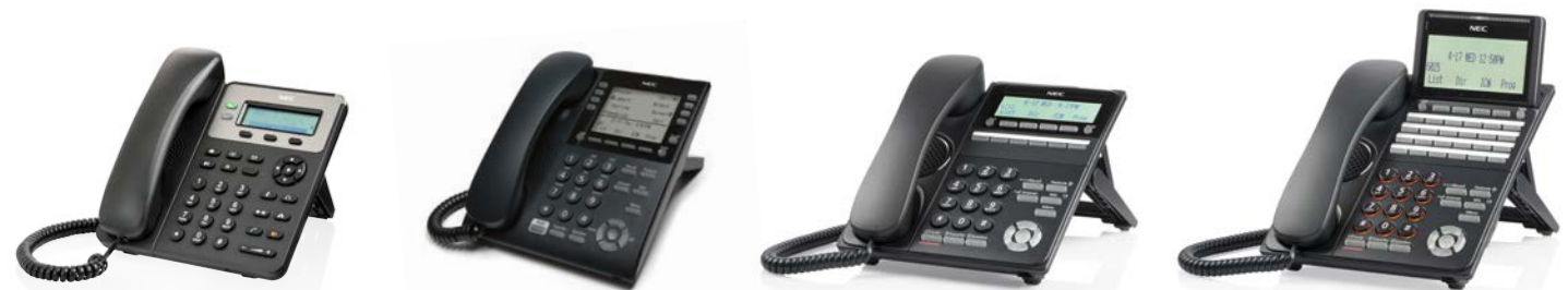
Terminali con display monocromatico

Per la gamma completa di telefoni SV9100 disponibili, visitare il sito www.nec-enterprise.com per ulteriori dettagli.