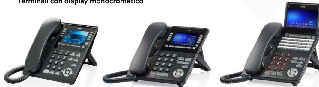
Terminali con display a colori